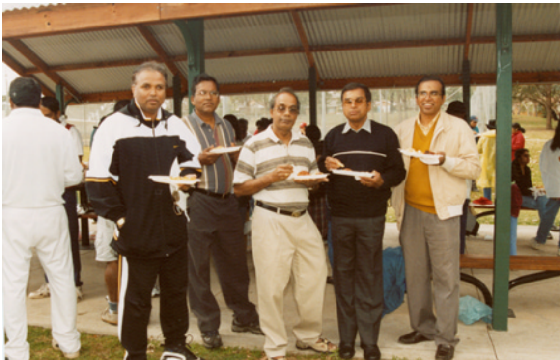
Hartley family and friends having their meals ...